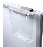
(WTGHOD) LEAFLET HOLDER PROSPEKTHALTER